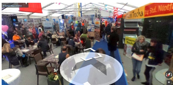
„Messe nach der Messe“ auf www.wir-2018.de

Das MSP-EXPO 2018 wird nicht nur während der Ausstellungstage zum Publikumsmagneten, sondern noch lange danach. Grund ist der Virtuelle Messerundgang, für den wir während dem MSP-EXPO 360° Fotos aufnehmen. Die Erfahrung zeigt, dass gerade die virtuellen Rundgänge hohe Besucherzahlen aufweisen und durch die Verbindung mit Google Maps neue Kundenkontakte generieren. Der Aufnahmezeitpunkt wird rechtzeitig angekündigt . Bitte stellen Sie sicher, dass gerade in dieser Zeit Ihr Stand besetzt ist.