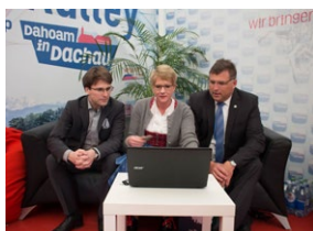
Bedruckte Standwände schaffen immer die richtige Atmosphäre

Die clevere Alternative zum herkömmlichen Messe-Display: Bedruckte Standwände sorgen für nahtlose, elegante Lösungen auf ganzer Fläche. So können Sie Ihre Präsentation immer aktuell halten und auf die jeweilige Ausstellungssituation zuschneiden. Zudem wird gegenüber herkömmlichen Displays mit 20-30 cm Tiefe enorm Platz gespart. Und auch das lästige Auf- und Abbauen fällt weg: bedrucken und entsorgen übernimmt die Messeleitung.