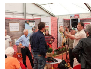
Beispiel: Landkreis Ansbach

Auf dem MSP-EXPO in Lohr a.Main besteht auch die Möglichkeit ganze Hallen in einem durchgängigem Design erstrahlen zu lassen.