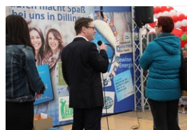
Sponsorenwand zum Thema „Einkaufen vor Ort“

Zukunft & Nachhaltigkeit / Bauen, Wohnen, Energiesparen / Vereine, Sport & Fitness / Gesundheit, Wellness & Pflege / Frauen / Regional & Haushalt / Weihnachten.